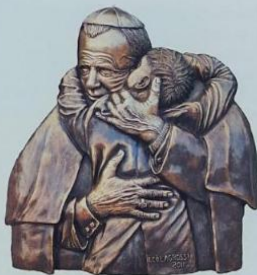
San Giovanni Paolo II

La Croce sparisce sotto l'umanizzazione estrema del volto che Ignazio Colagrossi sa rendere con la ineluttabile presenza della sofferenza e del martirio. E' il Cristo interpretato da un potente scultore capace di imprimere nel calco tutta la sua forza d'animo e tutta la disperazione di una specie umana. I suoi lavori, racchiusi entro i due modi di scolpire tra tradizione e contemporaneità, recuperano materiali e segni che vengono dai grandi maestri del nostro Rinascimento, attualizzando certi aspetti, come il taglio della figura, vivace e vitale, ampliato in certe parti che ne escono esaltate. E' uno scultore che sa indagare i segreti dell'anima aprendo alla rappresentazione dell'intimità sia felice che drammatica, illuminandola di lampi di luce che squarciano le grandi membra ed evidenziato gli attimi più intensi del racconto. I rilievi nei panneggi forniscono occasione di ombre e di sussulti, i capelli chiudono in parte i bui secolari dei vari passaggi della storia e forniscono linee che tratteggiano la rappresentazione dove l'umano e lo spirituale si alternano e si incontrano creando forti emozioni. Attingere alla sacralità della persona e ai Grandi della scultura costituisce una fonte inesauribile di ispirazione a cui Ignazio Colagrossi si ispira perpetuando la grande Arte.