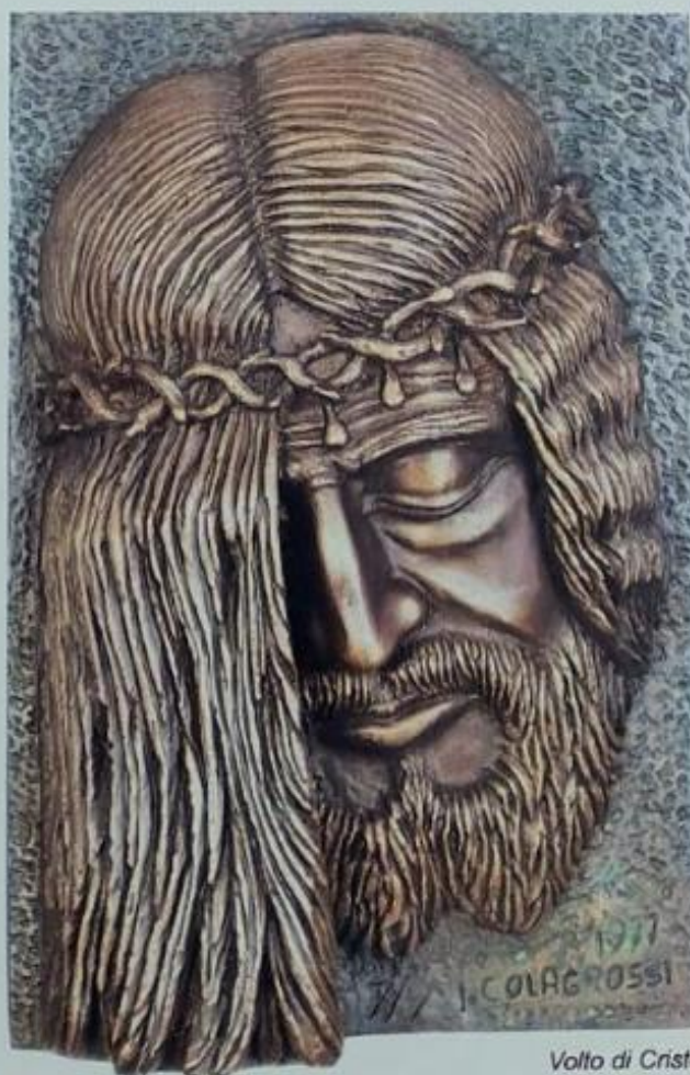
Volto di Cristo