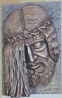
Volto di Cristo

In occasione dell'Anno Giubilare della Misericordia e della Pace nel Mediterraneo indetto da Papa Francesco, l'Accademia Internazionale dei Dioscuri, per meglio sottolineare questo evento e rafforzare i legami di pace tra i popoli del mediterraneo, ha deciso di istituire il prestigioso riconoscimento. 28 Maggio 2016 - Hotel Hermitage - Roma.