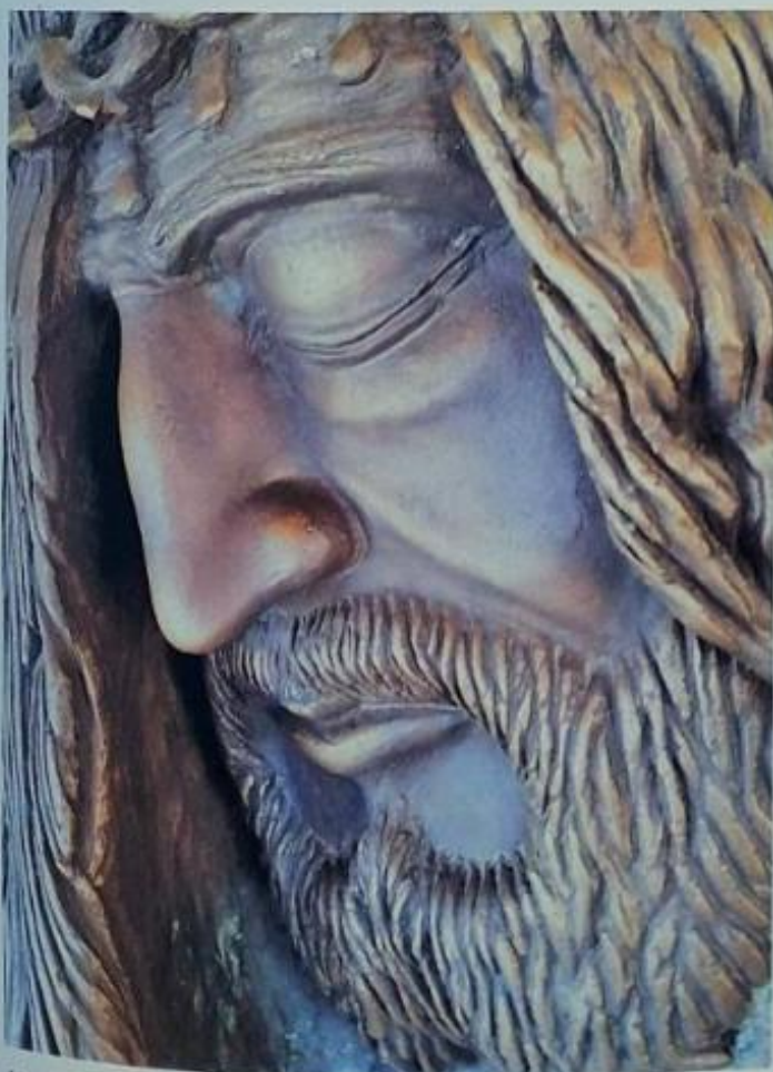
Volto di Cristo - particolare