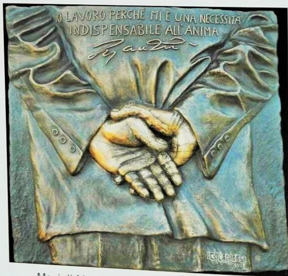
«Mani di Manzù» - altorilievo bronzo - 60x55x6