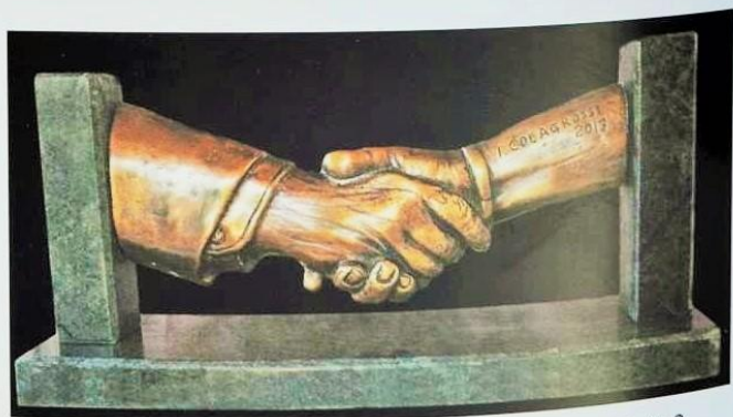
«Unione universale» - bassorilievo in bronzo - 23x9x2