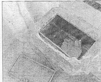
Alcune immagini della chiesa di La Gogna dopo il raid notturno

l'acquasantiera in ottone. «Il valore di quanto ci hanno portato via, escluso il pregevole volto di Gesù di Ignazio Colagrossi, non è elevato. Quanto accaduto ci ha colpiti invece nel profondo». Così hanno commentato il vile gesto alcuni dei più assidui frequentatori della piccola chiesa di Sant'Antonio da Padova a La Gogna, nella periferia di Aprilia, presa di mira dai ladri nella notte e completamente devastata. «Sono 24 anni che lavoriamo affinché la nostra comunità abbia un luogo di culto come punto di riferimento - spiegano ancora i residenti della zona - questo gesto così violento non riusciamo a spiegarcelo. E' la terza volta che i ladri entrano nella nostra chiesa - spiegano - ma mai erano stati provocati dei danni così pesanti. Siamo amareggiati, ma continueremo con il nostro progetto di aprire a breve un centro di ascolto. Domenica - concludono - si terrà ugualmente la messa all'esterno della nostra amata chiesa». I residenti de La Gogna lanciano anche un appello all'amministrazione comunale: «Ci sentiamo abbandonati - hanno detto - che si trovi una soluzione». Sulla violenta incursione notturna a La Gogna, indagano i carabinieri del Reparto Territoriale di Aprilia.