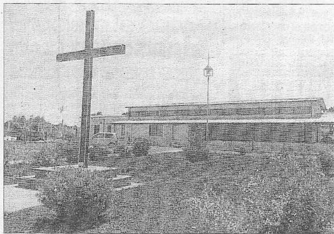
La chiesa parrocchiale di La Gogna

Danni alle strutture, rubati candelabri, ceri, immagini sacre e i soldi delle offerte