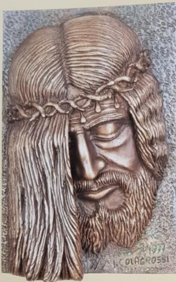
Volto di Cristo Anno 1997 - Tecnica Bronzo altorilievo cm. 27,5 x 40 h x 15 prof. L'opera è presente nei fondali di San Felice Circeo (LT) Chiesa dello Spirito Santo di Aprilia (LT) Chiesa di San Nicola da Bari Castel Nuovo di Farfa (RI) e collezioni private