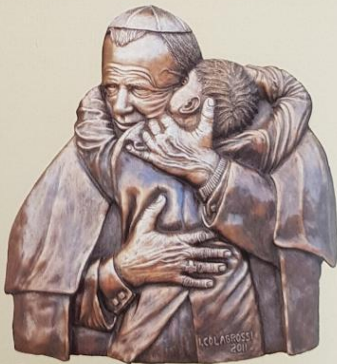
San Giovanni Paolo II Anno 2011 - Tecnica Bronzo altorilievo cm. 65 x 65 h x 9 prof. L'opera è presente in monumento in occasione della Beatificazione Chiesa Santa Maria degli Angeli - Santuario della Sindone San Felice Circeo (LT) ed in occasione della Santificazione Una copia dell'opera è stata postanella Sala Stampa della Santa Sede - Città del Vaticano