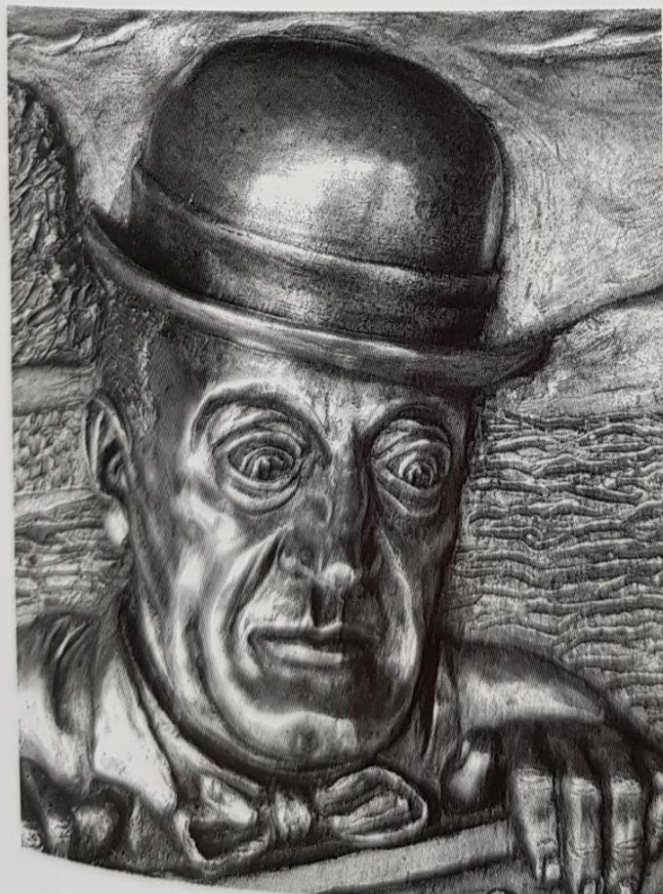
Colagrossi, Totò... livella! (part.), altorilievo in bronzo 100 x 70 x 15 cm, € 15.000/A

Formazione: autodidatta, in parallelo agli studi ecclesiastici si dedica fin da giovane all'arte nella sua accezione più ampia, spaziando dalla poesia alla pittura, alla scultura. Periodi: per diverso tempo si occupa di varie forme espressive, in seguito concentra il proprio interesse verso l'arte plastica, riconoscendo alla stessa una particolare forza certamente favorita dalla tridimensionalità. Nel 2010 la decisione di fondere in bronzo il Volto di Cristo , scultura realizzata nel lontano 1977 da un blocco di gesso, sottraendo materia al volume ed esprimendo nell'opera, con efficacia artistica, una propria sofferenza esistenziale. Soggetti: gli vengono commissionate opere a carattere religioso in alcune delle quali, come scrive il critico E.M. Eleuteri, «si eleva un concetto di un nuovo classicismo (...), libero da quella dinamica operativa fatta di masse informi (molto facili a eseguirsi), tipiche di molti attuali scultori». Tecniche: gesso o creta con la tecnica della sottrazione di materia e fusione in bronzo in arte plastica; tecniche varie in pittura.